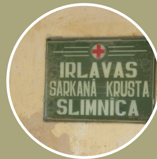
SIA «Irlavas Sarkanā Krusta slimnīca»