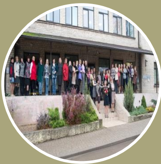
Tukuma novada pašvaldības aģentūra «Tukuma novada sociālais dienests»