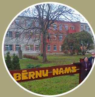
Irlavas bērnu nams – patversme