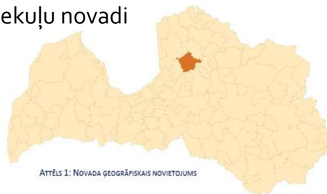
Attēls 1: NOVADA ĢEOGRĀFISKAIS NOVĪETOJUMS

KAIMIŅU PAŠVALDĪBAS: Amatas, Cēsu, Kocēnu, Krimuldas, Līgatnes, Limbažu un Priekuļu novadi